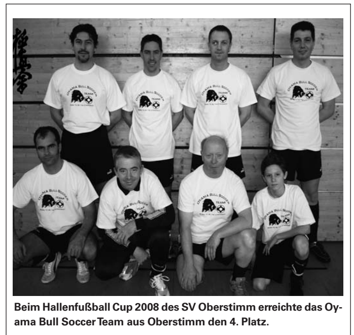
Beim Hallenfußball Cup 2008 des SV Oberstimm erreichte das Oyama Bull Soccer Team aus Oberstimm den 4. Platz.