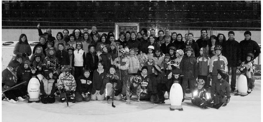
Ca. 80 Vereinsmitglieder folgten dem Angebot "Schlittschuhfahren in der Saturn-Arena" von Amici O. Der Verein hatte die Eishalle zwei Stunden für seine Mitglieder gemietet. Auf Grund der großen Resonanz gibt es vielleicht im nächsten Jahr eine Wiederholung.

Mit ca. 19 Aktionen war der Verein tätig und hat den Familien ein vielfältiges Freizeitangebot gemacht: Reit-, Kletterkurse, Basteln, sowie Spielplatz- und Kürbisfest sind nur ein kleiner Auszug dessen, was auf die Beine gestellt wurde. Auch für dieses Jahr ist schon vieles geplant. Begonnen hat das Jahr mit der Teilnahme am Faschingsumzug, bei dem sich über 30 Mitglieder als Bierkrüge verkleideten. Das nächste Highlight soll am 23. Februar in der Saturnarena sein, die der Verein für seine Mitglieder zum Schlittschuhlaufen gemietet hat. Ab April bietet AmiciO auch Trommelkurse, eine Kinder-Stadtführung und mehrere Kreativkurse an. Das aktuelle Programm kann im Internet unter www.amicio-oberstimm.de eingesehen werden. Für viele dieser Kurse werden Räumlichkeiten in Oberstimm benötigt. Leider gibt es die für die Oberstimmer Vereine nicht, so