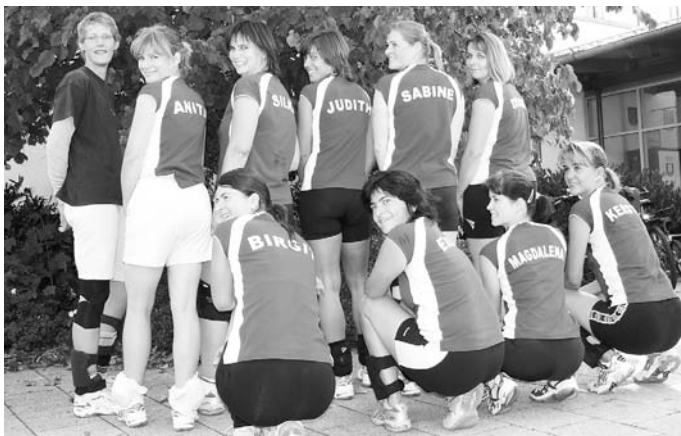
Die erste Damenmannschaft der MBB SG Manching scheiterte zwar im Titelkampf, blickt aber auf eine erfolgreiche Saison zurück.