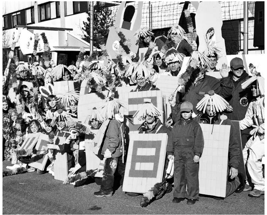
Die Volleyballer als „Putzschwamm-Armee“ beim Manschuko-Faschingsumzug