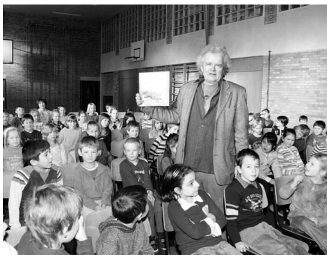
Lesen macht neugierig: Mit einer Autorenlung wollte der Kinderbuchautor Dirk Walbrecker in der Volksschule Oberstimm eine persönliche Beziehung zu seinen Büchern aufbauen. Alle Schüler aus den Grundschulklassen verfolgten in der Turnhalle die spannend vorgetragenen Geschichten.