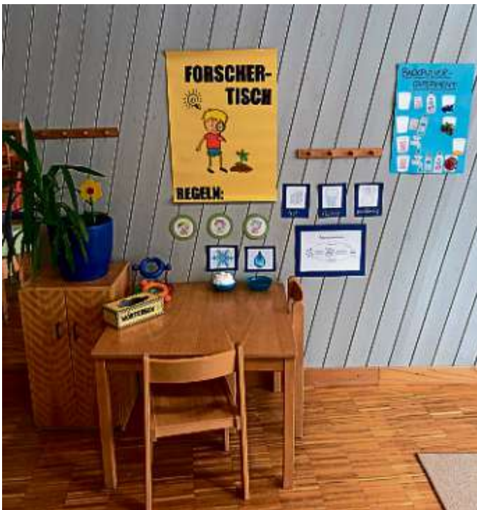
Markt Manching (MüK)

In unserem Kindergarten absolvieren derzeit zwei angehende Erzieherinnen ihr Berufspraktikum. Zur Qualifikation gehört eine schriftliche Facharbeit, mit Theorie (fundiertes Fachwissen) und Praxis (Umsetzung in der täglichen Arbeit und deren Dokumentation). In der Strolchen-gruppe wird fleißig experimentiert, u. a. mit Schnee, Backpulver, Licht und Schatten. Die Kinder zeigen viel Freude, indem sie mit Spannung die Vorgänge und dessen Veränderungen beobachten. Zum Schluss wird jedes Experiment bildlich dargestellt und festgehalten. Durch das gemeinsame Entdecken lernen die Kinder