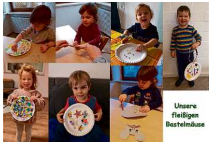
Markt Manching (HaD)

Trotz des Lockdowns und der Schließung der Kitas, sind ein paar Kinder bei uns in der Krippe zur Notbetreuung da. Mit ihnen basteln und gestalten wir natürlich fleißig der Jahreszeit entsprechend: verschiedene Schneemänner, „Schneegestöber“ aus Farbe und auch aus Watte, Tannennadelbilder, und vieles mehr. Damit den „Daheim-Geliebten“ nicht langweilig wird, gibt es diesmal eine „Abholkiste“, gefüllt mit Material, Vorschlägen und Angeboten zum Basteln, Rezepten (zum Backen und für Knete), als auch andere Sachen, bei denen man „aktiv“ werden muss. Beispielsweise Stro-