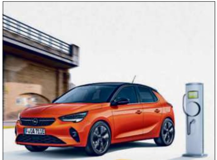
Beispielfoto der Baureihe. Ausstattungsmerkmale ggf. nicht Bestandteil des Angebots.

TEL.: 0176/76987631 GARTEN-SERVICE@OUTLOOK.COM