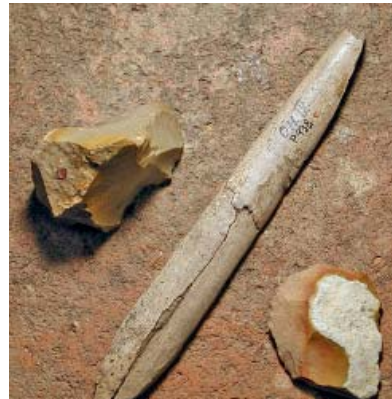
Knochenspitze Oberederhöhle Unteres Altmühltal