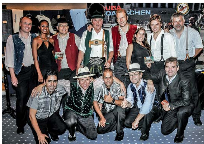
Die Cuba Boarischen mit ihren Freunden aus Havanna.