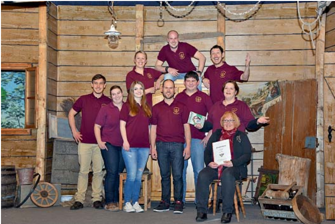
Schupfahupfa, ein altes Kinderspiel, heißt das Theaterstück, das die Manchinger Theaterbühne auf die zum Schupfa umgebaute Bühne zaubert.