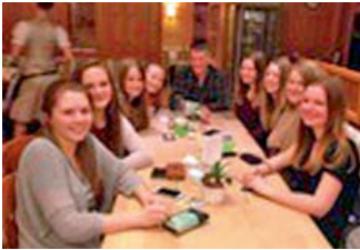
Die zweite Volleyball-Damenmannschaft bei der Saisonabschlussfeier Alois Rieder

Erstmals in der 30-jährigen Geschichte der Abteilung Volleyball der MBB-SG Manching gelang es zwei Mannschaften, die in der gleichen Liga antreten mussten, die Saison auf Rang eins und zwei abzuschließen. Dabei blieben beide Mannschaften – bis auf jeweils eine Niederlage gegen die eigenen Vereinskolleginnen – insgesamt ungeschlagen. Da die „Erste“ im Hinspiel gegen MBB 2 einen klaren 3:0-Erfolg feierte und die „Zweite“ im Rückspiel den Sieg gegen MBB 1 erst im Tie-Break schaffte, machte am Ende genau dieser eine Punkt den Unterschied zwischen den Meisterinnen und den Vizemeisterinnen aus. So hatte Manching 1