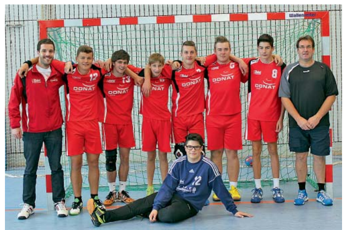
Männliche B-Jugend der MBB SG Manching