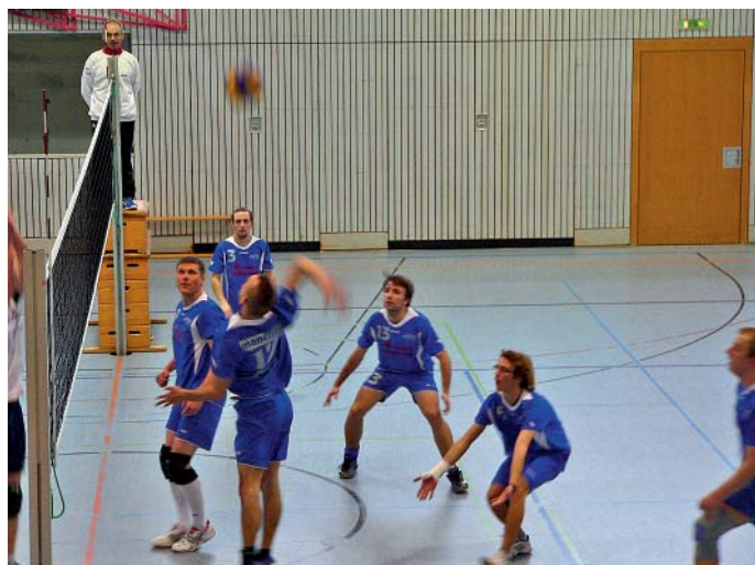
Spielezene Manching gegen Stammham.