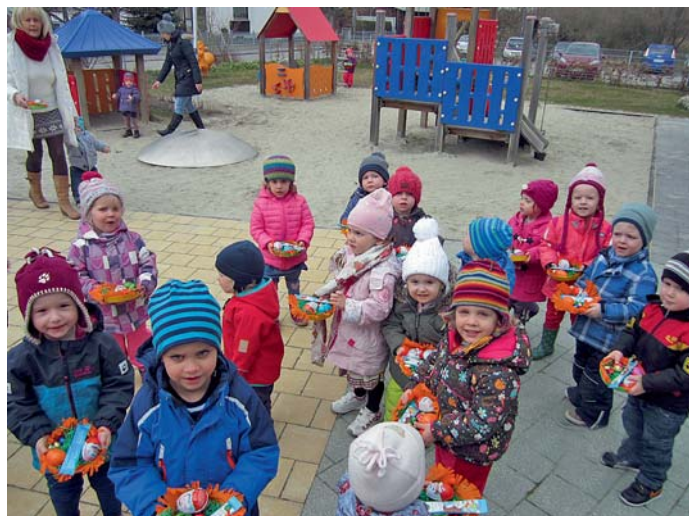
Markt Manching (ApS)

Das Wichtigste für Kinder ist und bleibt dabei die spannende Suche und die Freude beim Finden, der vom Osterhasen versteckten Nester. Ihre Begeisterung, ihr Staunen entspricht der Freude, die dem Osterfest im religiösen Sinn innewohnt. Die Krippenkinder der Mäusevilla sind mit Eifer und Freude dabei.