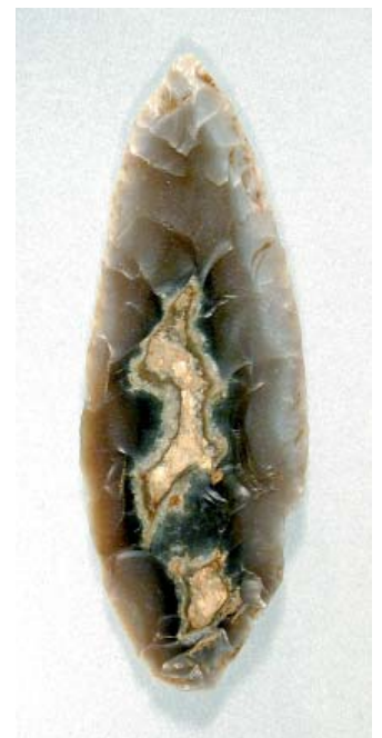
Blattspitze Oberederhöhle Unteres Altmühltal