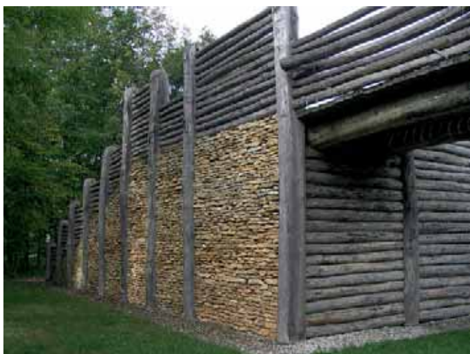
Nachbau des Keltentors in Kelheim

Zum Ausklang der Studienfahrt hielt die Gruppe, bevor es wieder Richtung Manching ging, nochmals Einkehr in einem historischen Gasthof in der 7-Täler Stadt Dietfurt. Dr. Georg Schweiger