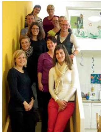
Markt Manching (KöS)