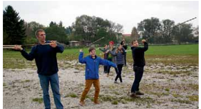
Die selbst gefertigten Speerschleudern und Speere im Praxistest