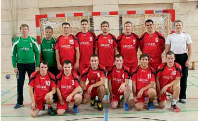
1. Herrenmannschaft der MBB-SG Manching