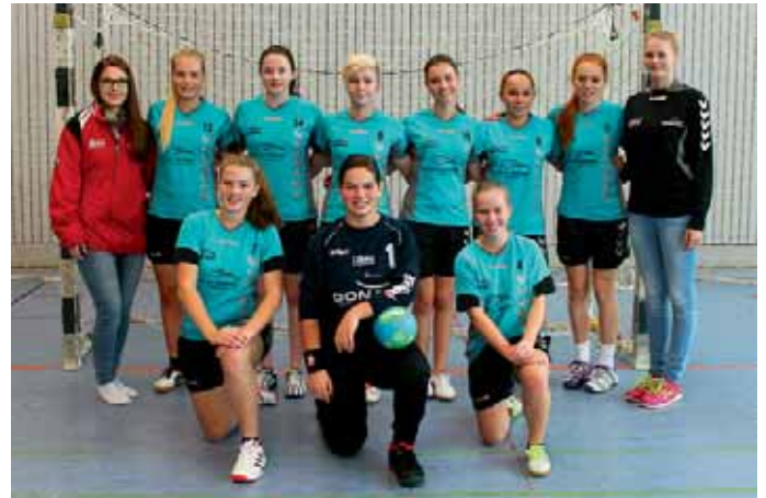
Weibliche B-Jugend der MBB SG Manching

Ihre allerersten Punktspiele haben inzwischen die beiden neuformierten D-Jugend-Mannschaften der Handballer der MBB-SG Manching absolviert. Wenn sich die Anfangsnervosi-