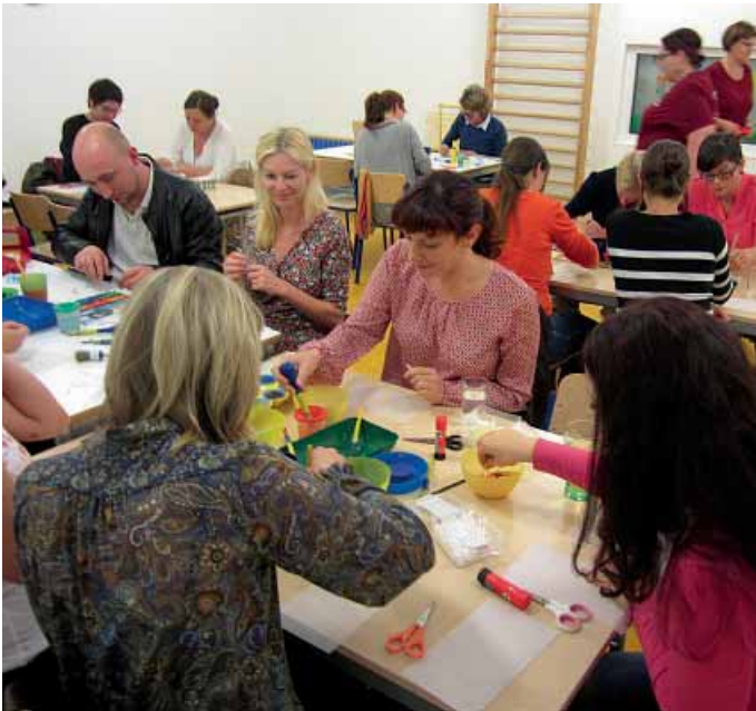
Markt Manching (KöS)

Einen erfolgreichen ersten Elternabend konnte die Kinderkrippe „Mäusevilla im Lindenkreuz“ für sich verbuchen!