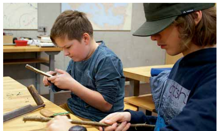
Die Teilnehmer der Schülerakademie schnitzen Steinschleudern