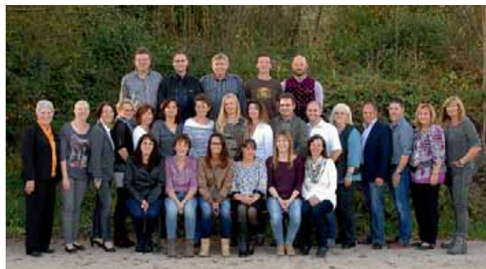
Am Samstag, 18.10.2014 – 30 Jahre nach Entlass – traf sich die Abschlussklasse 1984 der Hauptschule Manching zum Klassentreffen im Kleintierzuchtverein. Da es viel zu erzählen gab, dauerte die Feier bis in die frühen Morgenstunden.