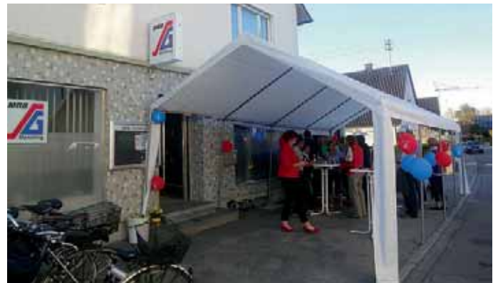
Eröffnungsfeier der neuen MBB-Geschäftsstelle in der Grundstraße.