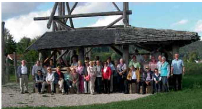
Der Freundeskreis in der Keltischen Siedlung in Oberhofen.

Eine spannende Tagestour auf den Spuren der Kelten