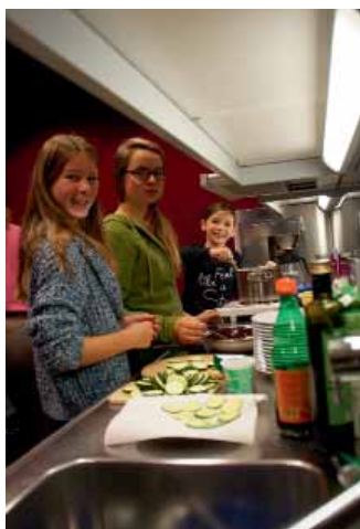
Römische Köchinnen am Werk

kelten römer museum manching Im Erlet 2 85077 Manching 08459/323730 www.museum-manching.de