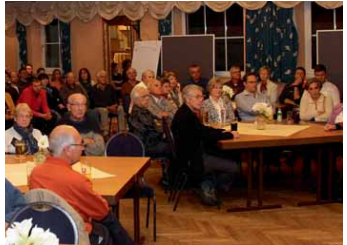
Zahlreiche interessierte Bürger fanden sich zur Bürgerbeteiligung im Manchinger Hof ein.

Im zweiten Teil der Veranstaltung waren nun die Bürger gefragt. In sechs Arbeitsgruppen brachten die interessierten Bürger ihre Ideen und Anregungen für die Zukunft ein. Die Themen reichten von erweiterten Wander- und Radwegen oder Fahrradabstellplätze an Bushaltestellen hin zu Ansiedlung von kleinen Geschäften, Einkaufsmöglichkeiten und Cafés im Zentrum oder der Erweiterung der Beschilderung von Kulturstätten. Besonders wichtig war den Bürgern auch das Thema Angebote und