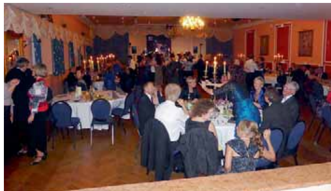
Blick in den Saal des Manchinger Hofes beim 6. Galaball der MBB-SG Manching.