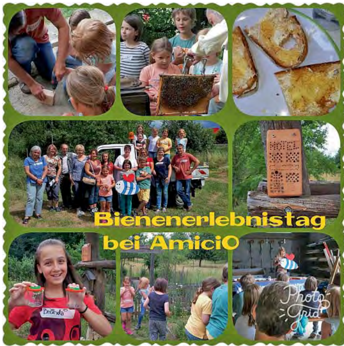
Bienenerlebnistag bei AmiciO