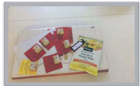
SV Oberstimm und das Bürgerhaus sagen den Helfern Danke!