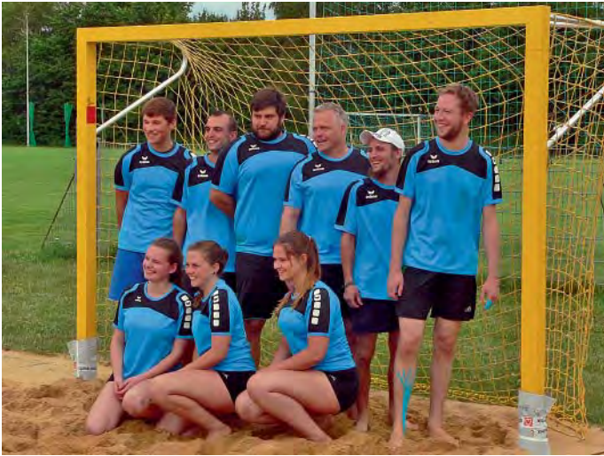
MBB-Volleyballer bei der 2. Beachhandball-Marktmeisterschaft