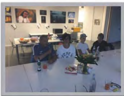
Die Jugend gestaltet mit!