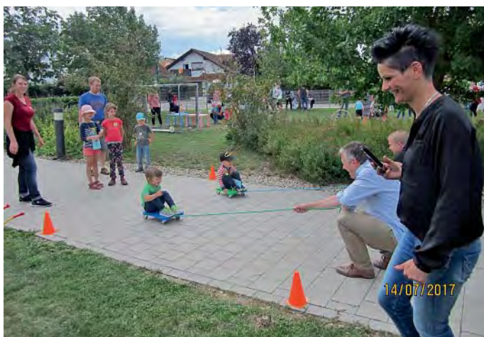
Markt Manching (K&S)

Nachdem wir den Termin im Mai verschoben mussten, war es endlich so weit, dass unsere lang ersehnte Familienolympiade stattfinden konnte.