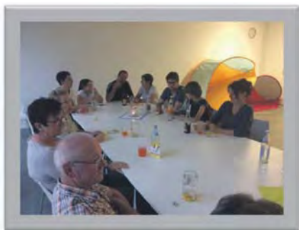
Kooperationen sind wichtig! Gemeinsam schafft man mehr! Vernetzung macht vieles möglich! Viele Ideen stärken die Kreativität! Hand in Hand bringt viel Spaß!