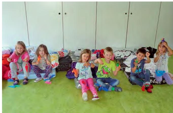
Markt Manching (TrA)

Hurra, endlich ist es so weit! Sechs Vorschulkinder durften mit ihren beiden Erzieherinnen von Freitag auf Samstag in der Kita übernachten.