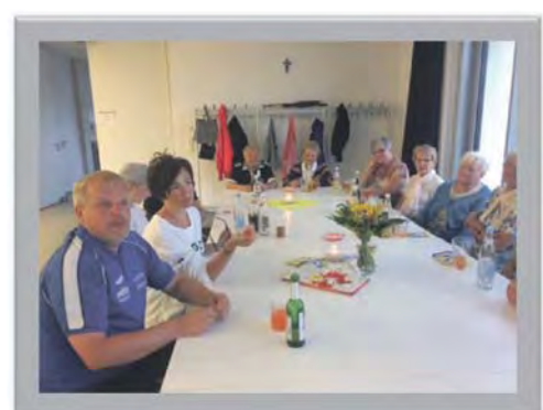
Austausch nach dem Fest ist schon die Vorbereitung für das neue Fest! (ScU)