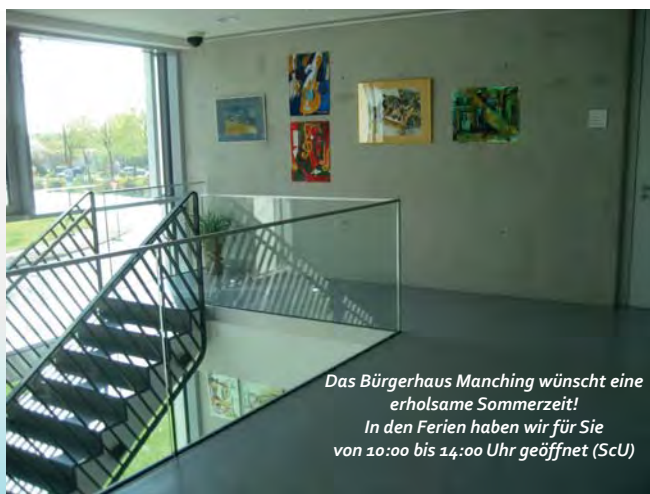
Das Bürgerhaus Manching wünscht eine erholsame Sommerzeit! In den Ferien haben wir für Sie von 10:00 bis 14:00 Uhr geöffnet (ScU)