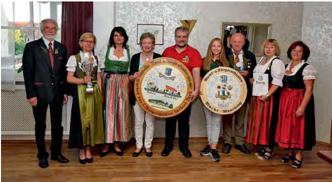
Die Bürger- und Marktkönige aus Manching aus der 30. Marktmeisterschaft im Schießen.