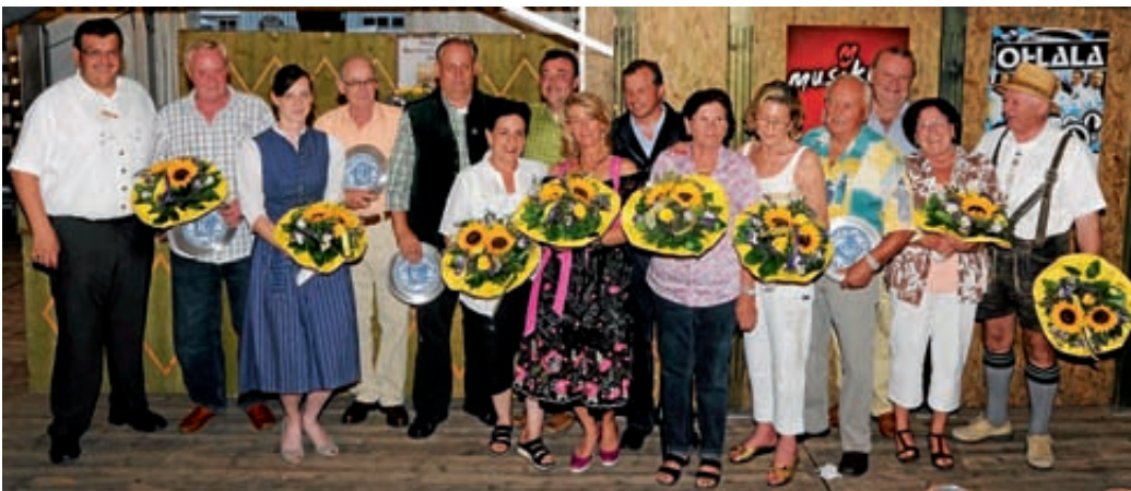
Zu Beginn des Barthelmarktes wurden langjährige Marktkaufleute vom Markt Manching geehrt.