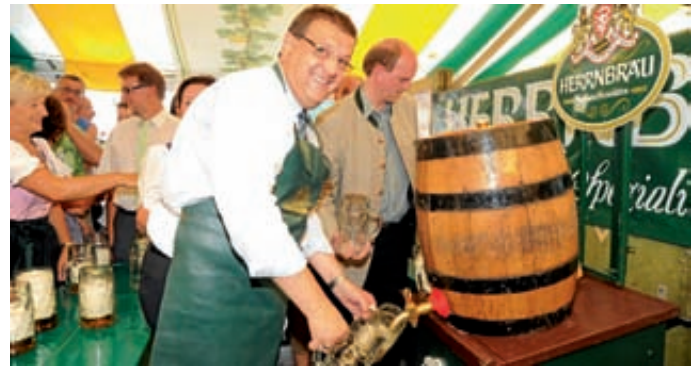
Ozap is – Bürgermeister eröffnet Barthelmarkt 2011.