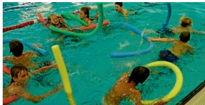
Die Kinder sind bei der Wasserwacht gut aufgehoben.

Wir wissen, dass den Kindern und Jugendlichen wichtig ist, dass sie zeigen können, was sie gelernt haben. Daher nehmen wir die Deutschen Jugendschwimmabzeichen (Freischwimmer) ab. Die Gruppenstunden, in denen die Erste Hilfe gelehrt wird, finden alle vier Wochen während der Trainingszeit im Wasserwacht Ausbildungsgebäude (altes Feuerwehrhaus) in Manching statt. Die Rettungsschwimmabzeichen ab 12 Jahren ist ein großer Bestandteil des Trainings. Aber auch der Spaß darf natürlich nicht zu kurz kommen. Ein wichtiger Aspekt bei den „Großen“ ist das sportliche Schwimmen für Fitness, Ausdauer und Kondition. Es werden nicht nur Befreiungsgriffe und Rettungsmechanis-