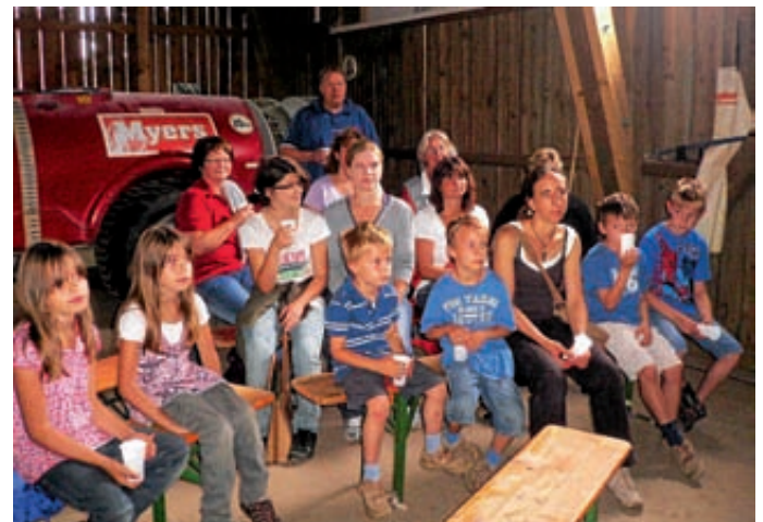
Andächtig lauschten die Kinder den Erzählungen der Hopfenbäuerin.