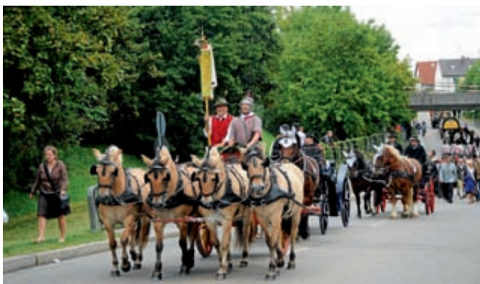
Festzug zur Rennwiese – 2011 mit neuer Rennbahn.