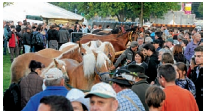
Traditioneller Rossmarkt am Montag Morgen.