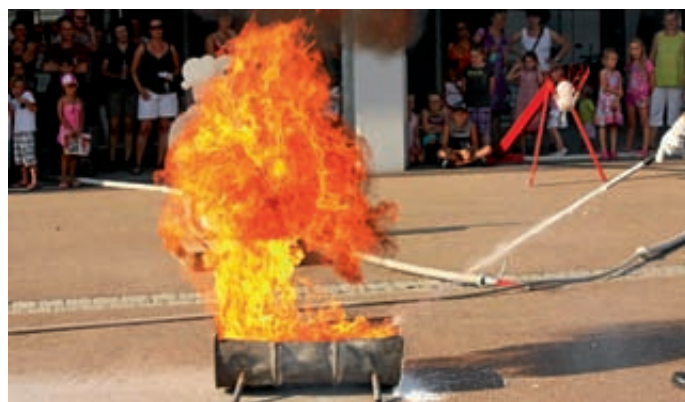
Löschen eines Fettbrandes.