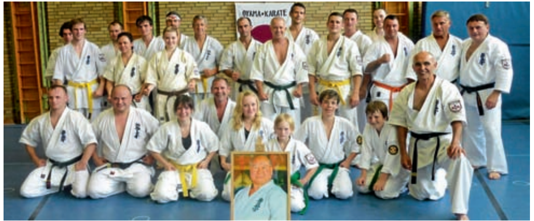
Die Teilnehmer am Kyokushin-Karate-Shihan-Lehrgang 2011.