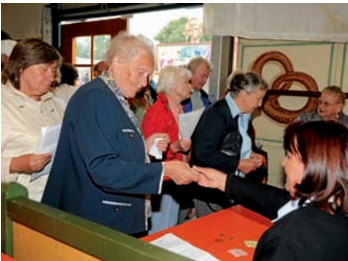
Auf dem Barthelmarkt herrschte großer Andrang beim Seniorenachmittag.