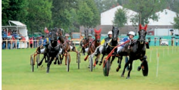
Trabfahrer im Sulky der Klasse C über 1800 Meter.

Um den neu angelegten Rennplatz, der im Zuge der neuen Auffahrtsrampe zur Bundesstraße 16 um 40 Meter nach Süden verlegt wurde, einen würdigen Rahmen zu verleihen, begleitete ein römischer Kampfwagen, gezogen von vier Gäulen, den Umzug. Der Kampfwagen drehte auch eine Ehrenrunde, nachdem das über den Platz gespannte Band