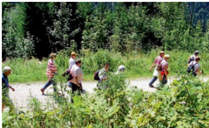
Erkundung der Wanderwege und Erholung in der Natur

Zu den beiden Touren gibt es eine kleine Broschüre mit Lageplan, Wegbeschreibung und Hinweisen auf markante Punkte mit geschichtlichem Hintergrund