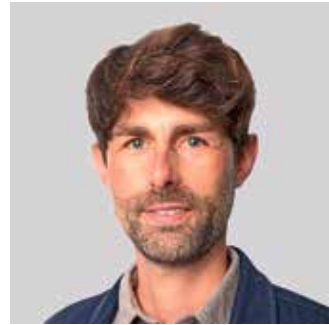
Raith Sebastian, Bündnis 90/ Die Grünen Ausschuss für Bauwesen, Umwelt- und Naturschutz, Land- und Forstwirtschaft