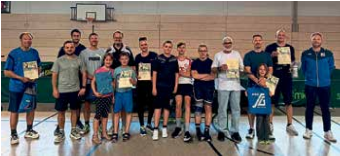
Teilnehmer der 3. Marktmeisterschaft im Tischtennis