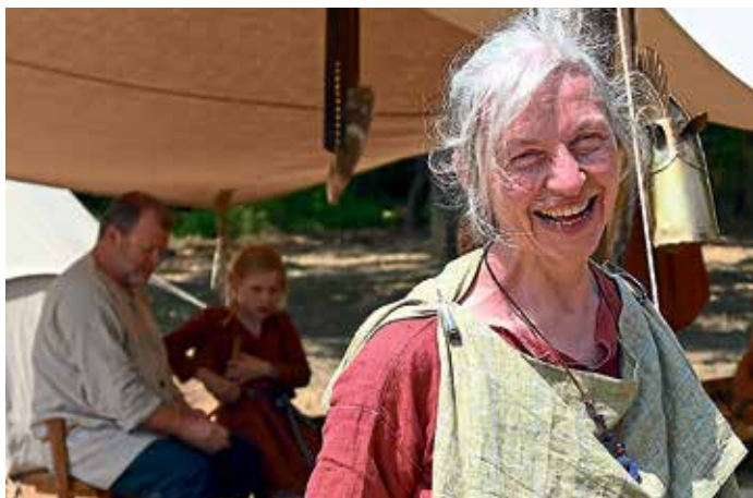
Die Historische Darstellungsgruppe München präsentiert keltisches Leben vor 2.000 Jahren.