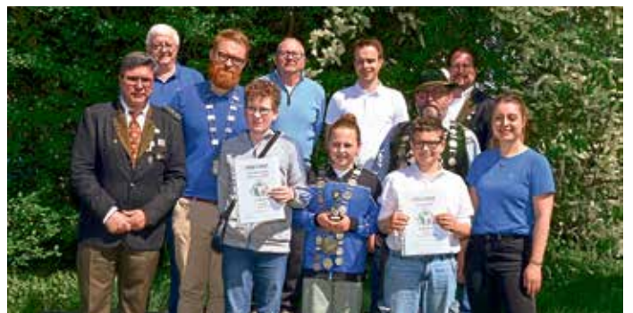
Ein Gruppenfoto mit den Schützenkönigen und Vereinsmeister von den Hubertusschützen aus Niederstimm: