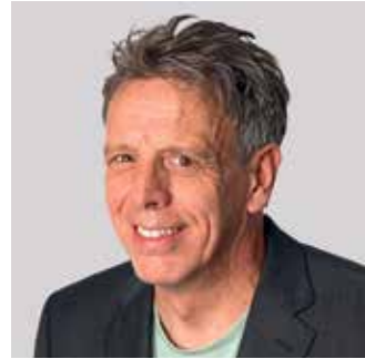
Köll Thomas, Bündnis 90/Die Grünen Hauptverwaltungs-, Finanz-, Gemeinde- entwicklungs- und Werksausschuss Marktausschuss