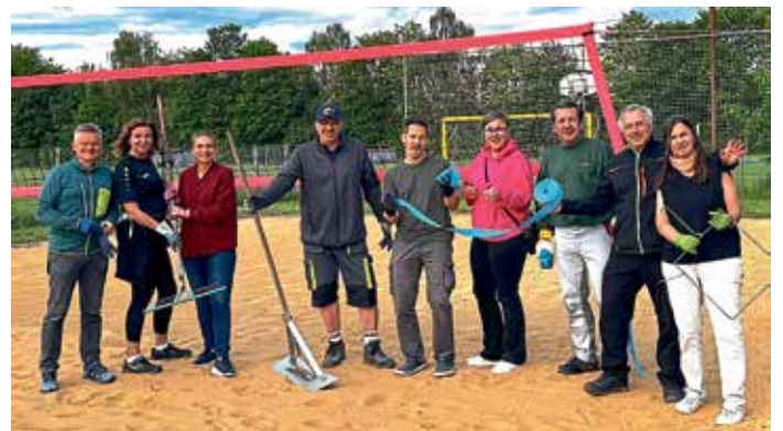
Herrichten des Beachplatzes am MBB-Vereinsgelände in Pichl