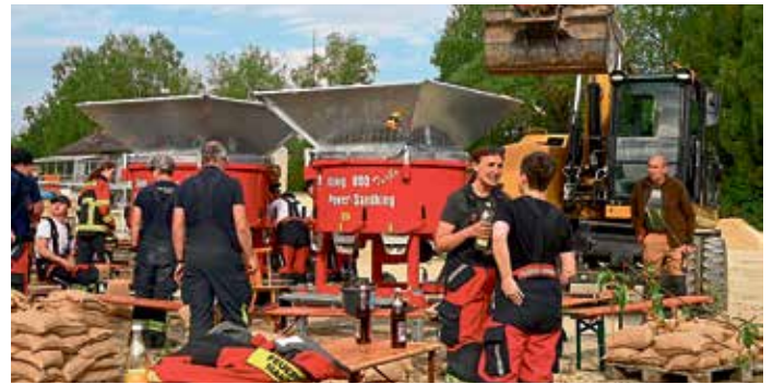
Bei einem Hochwassereinsatz muss im Ernstfall jeder Handgriff sitzen. Das übte die Manchinger Feuerwehr unter realistischen Bedingungen.