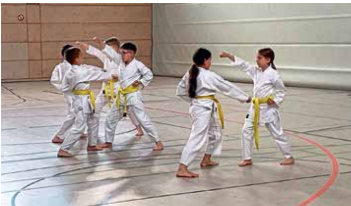
Die Gelbgorde der Manchinger Karateka in Aktion