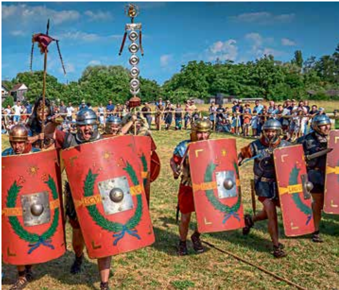
Die Römer kommen zum Kelten Römer Fest 2026!

Großes Museumsfest zum 20. Geburtstag: Am Wochenende des 4. und 5. Juli 2026 präsentiert das kelten römer museum ein großes Spektakel mit zahlreichen Attraktionen.