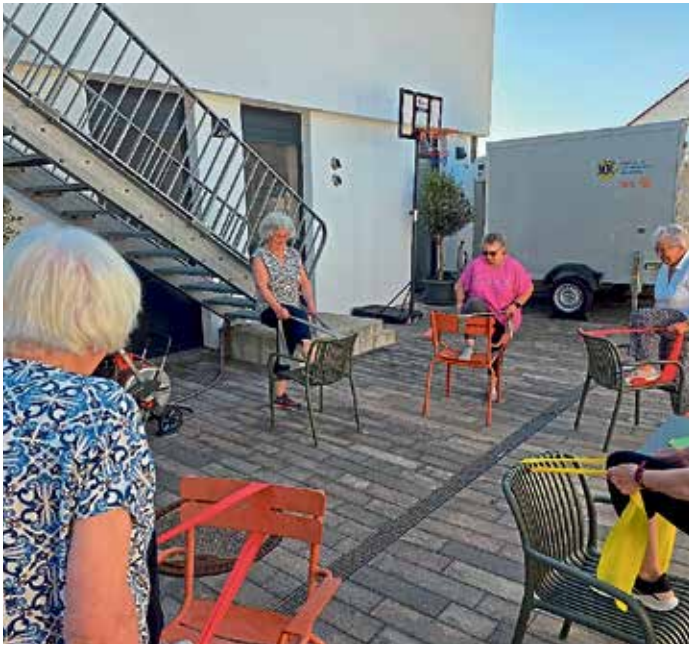
Seniorenportgruppe im Bürgerhaus Markt Manching

Bewegung fördern, Gesundheit stärken und Menschen zusammenbringen: Mit dem Projekt „Sport vor Ort“ startet im Landkreis Pfaffenhofen ab Juni 2026 ein neues Netzwerk niedrigschwelliger Bewegungsangebote im öffentlichen Raum. In zahlreichen Gemeinden werden offene und kostenfreie Sport- und Bewegungsangebote geschaffen.