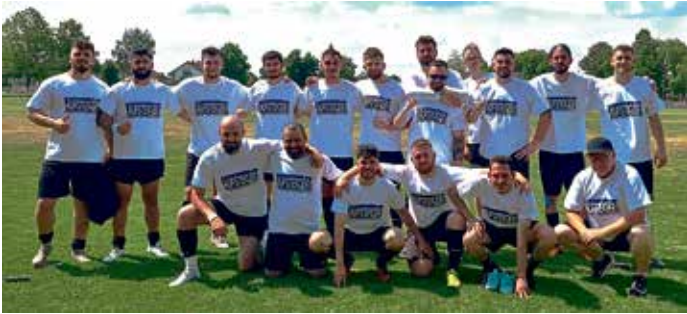
Die zweite MBB-Fußballmannschaft feiert den Aufstieg in die B-Klasse.

Die zweite Fußballmannschaft der MBB SG Manching erreichte zum Ende der Punktrunde 2025/26 den Aufstieg in die B-Klasse. Mit einem klaren 5:2-Erfolg gegen den SV Geroldshausen sicherten sich die MBB-Fußballer bei ihrem letzten Spieltag am 30. Mai den Aufstieg als Ta-