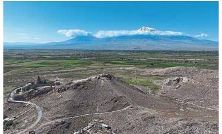
Ansicht der Oberstadt von Artaxata vor der Bergkulisse des Ararat.