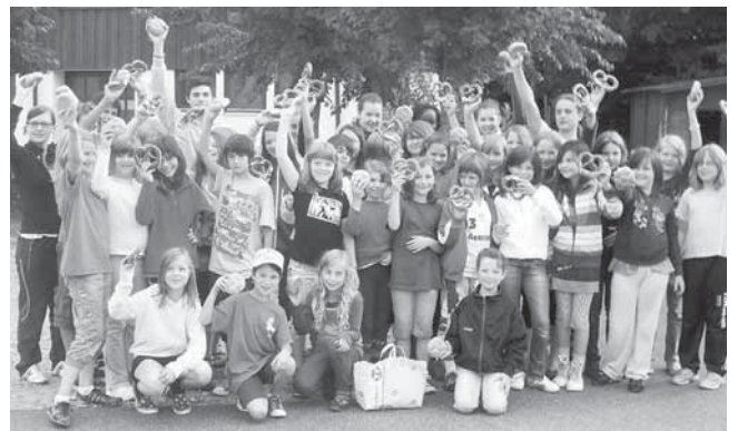
Das Frühstück für das Jugendzeltlager der MBB SG Manching Volleyballabteilung wurde von der Bäckerei Hackner aus Manching gespendet! 35 Kids und 7 Betreuer bedanken sich hierfür recht herzlich.