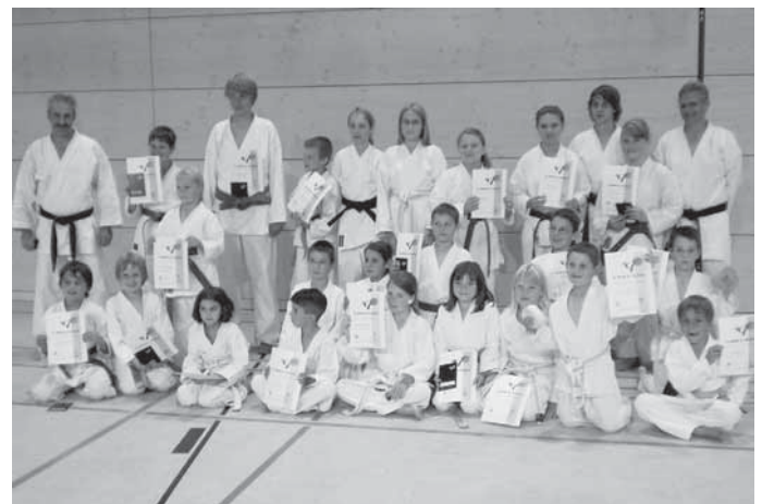
Die erfolgreichen Karatekas der MBB SG Manching nach der Gürtelprüfung in der Realschulturnhalle am Keltenwall.

Alle näheren Infos über das Trainingsangebot, Trainingszeiten, Beiträge etc. gibt es auch auf der Homepage: www.mbb-sg-manching.de/karate