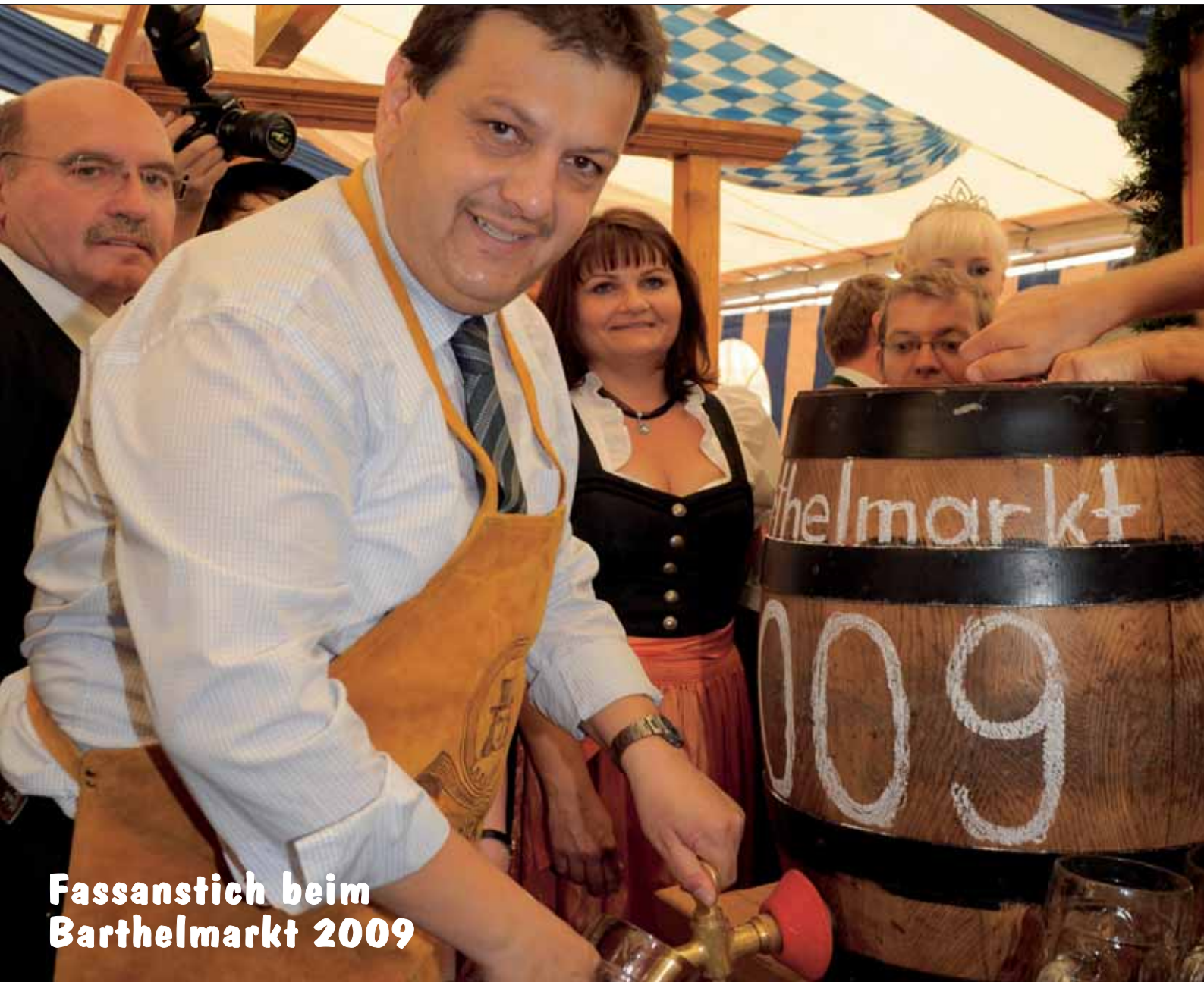
Fassanstich beim Barthelmarkt 2009

Fahrzeugweihe mit Feuerwehrfest Mitglieder geehrt