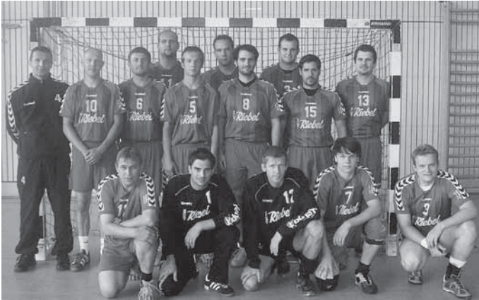
Die beiden Herrenmannschaften der MBB SG Manching.