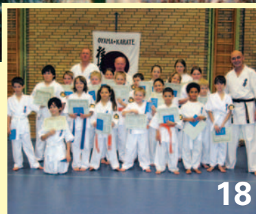
Gürtelprüfung bei Oyama Karate