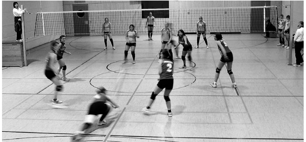
Spielezene der zweiten MBB-Damenmannschaft im Vordergrund gegen den TSV Neuburg III.

Im ersten Rückrundenspiel des Jahres traf die erste Herrenmannschaft in eigener Halle auf den SC Eching. Klar überlegen zeigte sich das MBB-Team im ersten Satz und gewann deutlich mit 25:16. Doch schon im 2. Satz zeigten die Manchinger ihre Schwäche, ein Spiel trotz Überlegenheit nicht entscheiden zu können. Nach vielen vergeblichen Chancen gewann Eching 29:27. Nachdem die Hausherren mit Einwechslung des stark aufspielenden Stefan Schauer den 3. Satz wieder klar 25:15 gewonnen hatten, setzten sie sich auch im 4. Durchgang knapp mit