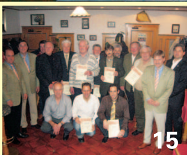
Weihnachtsfeier beim SV Manching