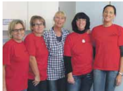
Helferteam beim Bayerischen Kid's Cup 2011

Deshalb auf diesem Weg noch ein herzliches Dankeschön an alle engagierten Helfer der MBB-Karate-Abteilung.