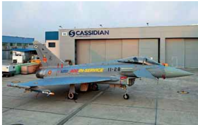
Eurofighter Typhoon für die spanische Luftwaffe Marco Valerio Bonelli

Die Eurofighter Typhoons – entwickelt und gefertigt von Cassidian in Deutschland und Spanien, BAE Systems in Großbritannien und Alenia Aeronautica in Italien – sind derzeit rund um die Welt mit 16 Einheiten in sechs Luftwaffen im Einsatz, wo sie elf Flugzeugtypen ersetzt haben. Damit beweist Eurofighter, nicht nur das leistungsstärkste auf dem Weltmarkt verfügbare Mehrzweckkampfflugzeug, son-