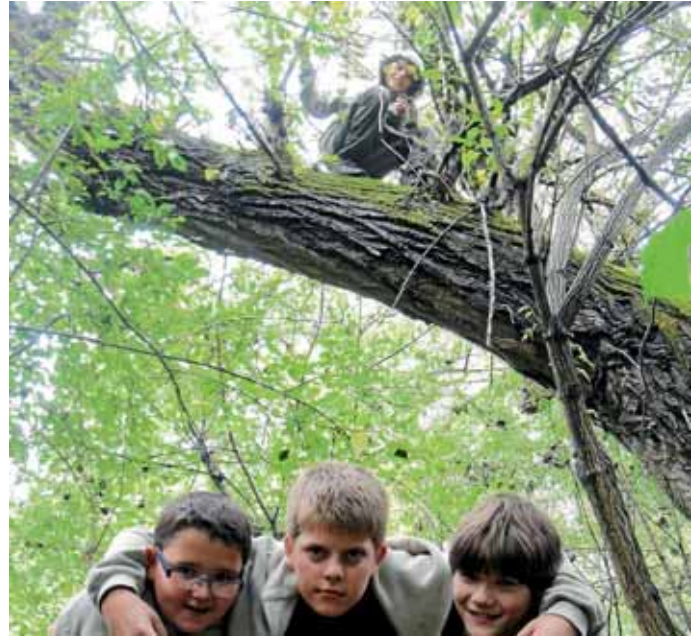
Die Mitglieder der Jugendgruppe „Jungstrupp“ beim Verstecken des Geocoins