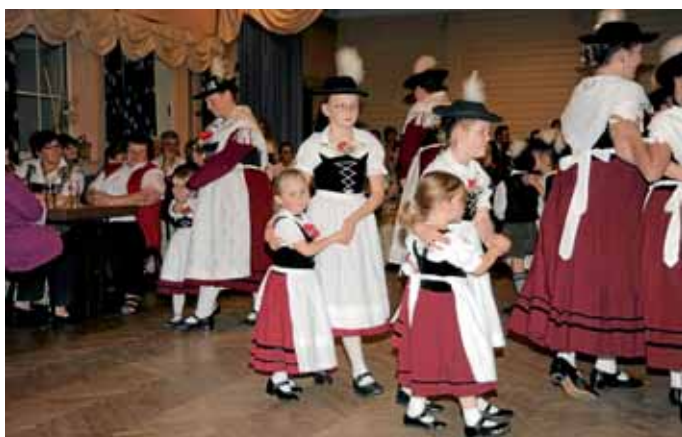
Stolz präsentierte die Manchinger Trachtenjugend auf dem Heimatabend, was sie gelernt haben Max Schmidtnr

Der Obst- und Gartenbauverein Manching lädt alle Mitglieder und Gartenbaufreunde am Freitag, dem 25. November, ab 19.30 Uhr in das Gasthaus im Sportpark zur Weihnachtsfeier ein. Den besinnlichen Teil gestaltet die Oberstimmer Hoagarten-Musi. Max Schmidtnr