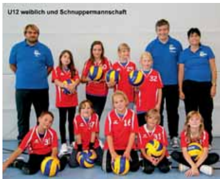
Von links: Die MBB-Volleyballmädchen der U12, U13 und U14