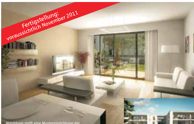
Abbildung stellt eine Mustereinrichtung dar.