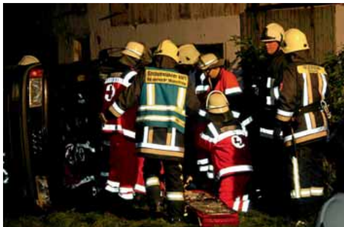
Retten einer verletzten Person aus dem Haus

Es war also Eile geboten, um die Eingeschlossenen aus ihrer misslichen Lage zu befreien. Die ersten Wehren meldeten sich bereits 4 Minuten nach der Alarmierung an. Der Einsatzleitwagen war als erstes Fahrzeug an der Einsatzstelle und der 1. Kommandant übernahm die Einsatzleitung und erkundete sofort mit einem Zugführer die Lage. Nachdem die Gaskonzentration gemessen war, konnte die Einsatzlage in Aufgaben und Abschnitte für die bereits eintreffenden Feuerwehren eingeteilt werden. Die Feuerwehr Manching bekam für die Gruppe des LF 16 den Auftrag, die eingeklemmten Personen aus dem umgekippten PKW im Innenhof zu befreien und die Person im Eingangsbereich, die unter einem Holzstapel lag, zu retten. Der zweite Zugführer