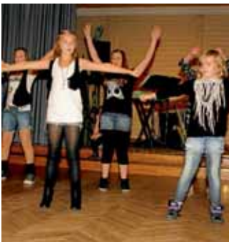
HipHop-Tanzgruppe der MBB SG in Aktion