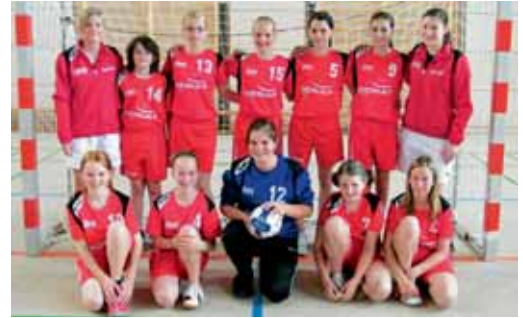
Weibliche C-Jugend der MBB SG Manching