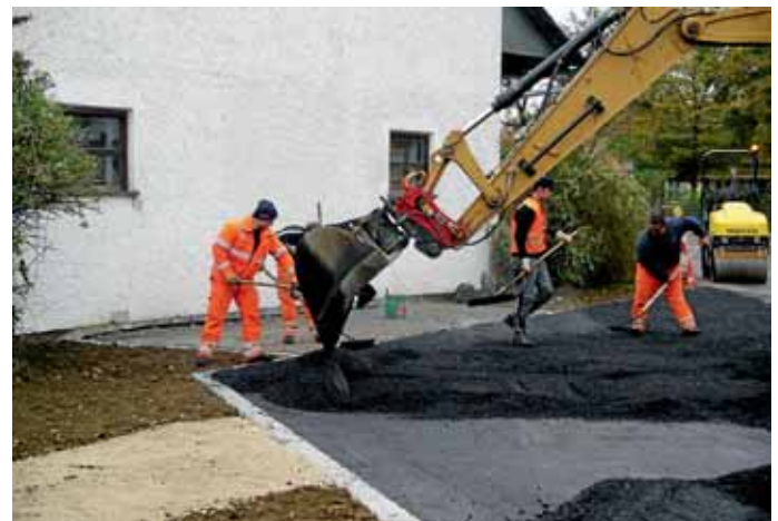
Personal und Maschinen dienen der Allgemeinheit