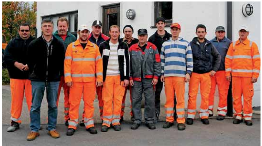
Mitarbeiter des gemeindlichen Bauhofes