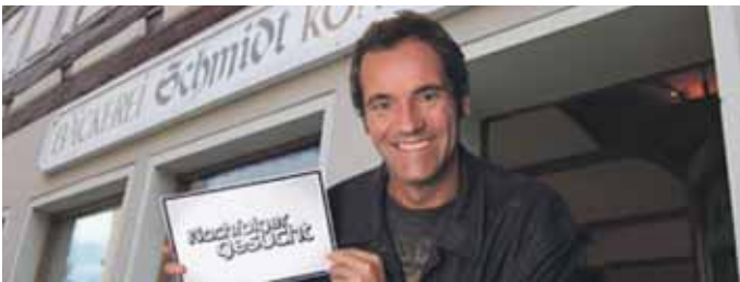
Thomas Ohrner vom Bayerischen Rundfunk

Falls wir Ihr Interesse geweckt haben, kontaktieren Sie uns! Entweder telefonisch unter der (0 89) 96 98 93-4 35 – oder per E-Mail: nachfolger@blueeyes.de