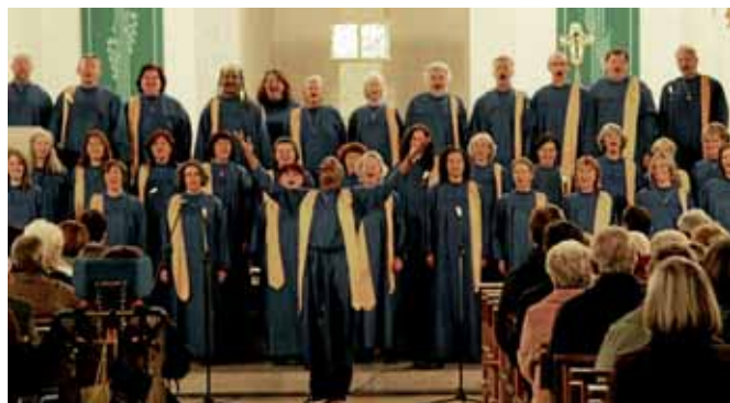
Die Münchner Gospelsterne in der Pfarrkirche St. Peter (SiG)

Mit diesem angenehmen Wir-Gefühl sowie der inneren Zufrieden- und Berührtheit verließen die Besucher die Pfarrkirche in die von frischem Wind und Regen erfüllte samstägliche Nacht . . . Markt Manching (SiG)