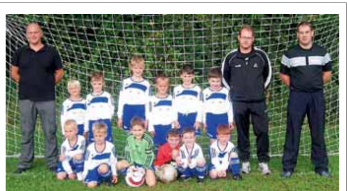
Die neu gegründete F-Jugend der Fußballabteilung der MBB-SG Manching bedankt sich bei der Fa. GTU-Systeme (Gesellschaft für Tanküberwachungssysteme und Anlagenbau mbH) für die neuen Trikots.

tiger Sketch auf dem Programm. Anschließend werden zahlreiche Mitglieder geehrt. Eine reichhaltige Tombola beschließt die Feier. Alle Mitglieder, Freunde und Gönner des Vereins sind hierzu herzlich eingeladen. Raimund Lögl