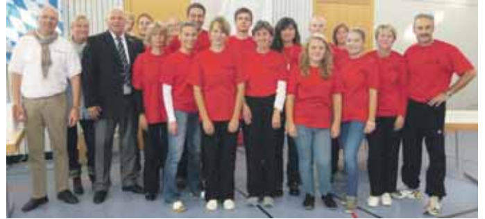
Verantwortliche des Bayerischen Kid's Cup 2011