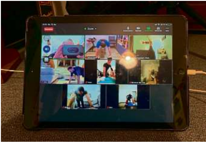
MBB-Volleyball-Herrenmannschaft beim Online-Training zu Hause