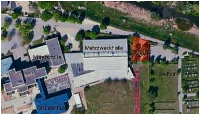
Markt Manching (MaS)

Am 1. 3. 2021 starteten die Sanierungsarbeiten an der Laufbahn und Weitsprunganlage der Grund- und Mittelschule im Lindenkreuz. Zur Gewährleistung der hierfür notwendigen Zufahrt und Baustelleneinrichtung ist der