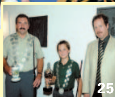
Sportfischerverein kürt Fischerkönige