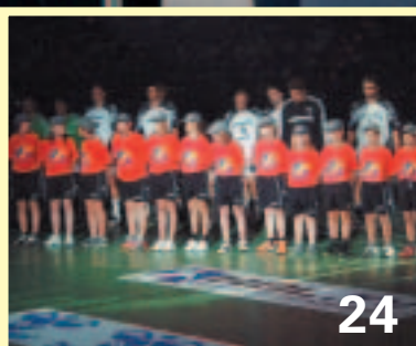
MBB Handballjugend weltmeisterlich ausgezeichnet