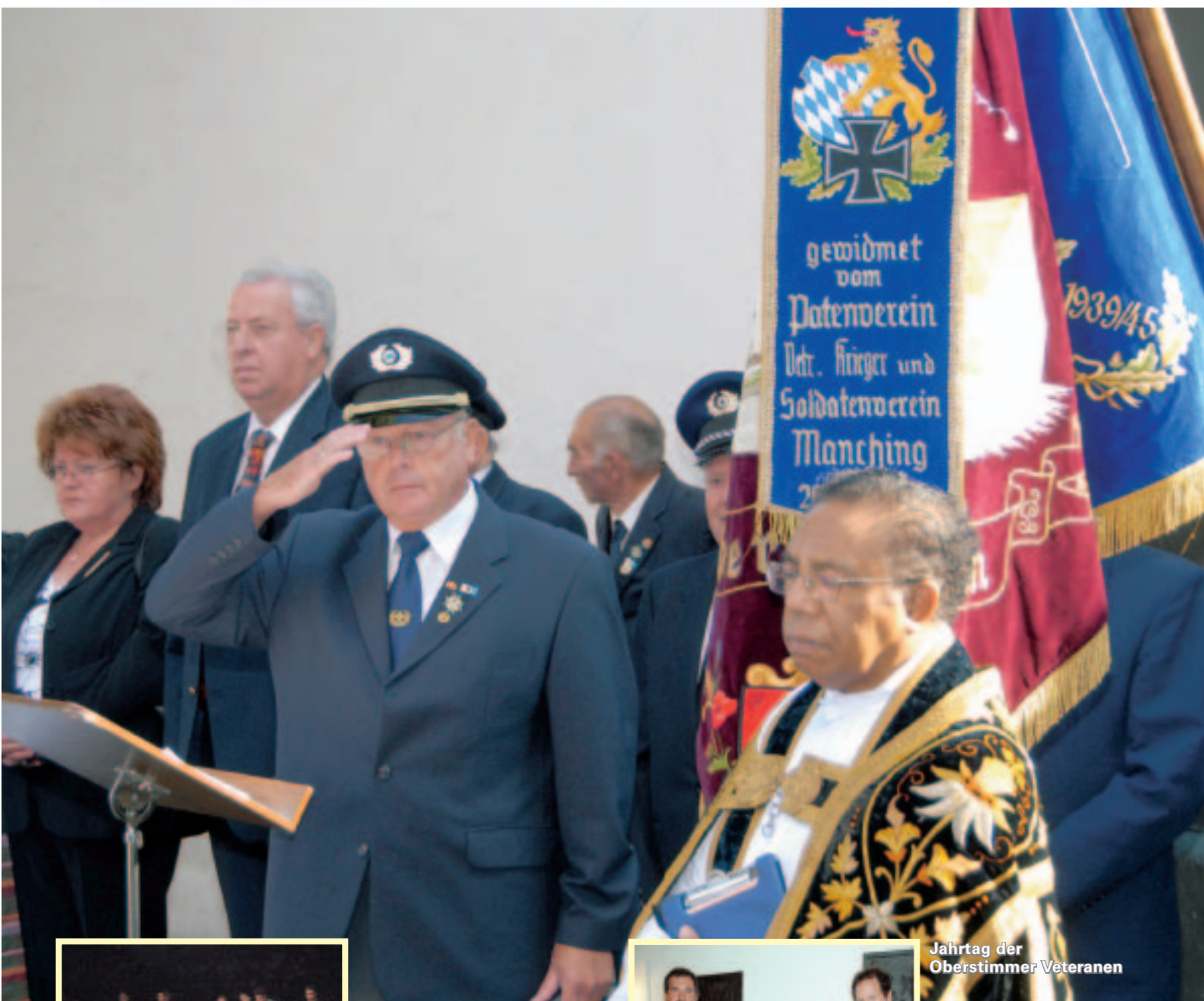
Jahrtag der Oberstimmer Veteranen