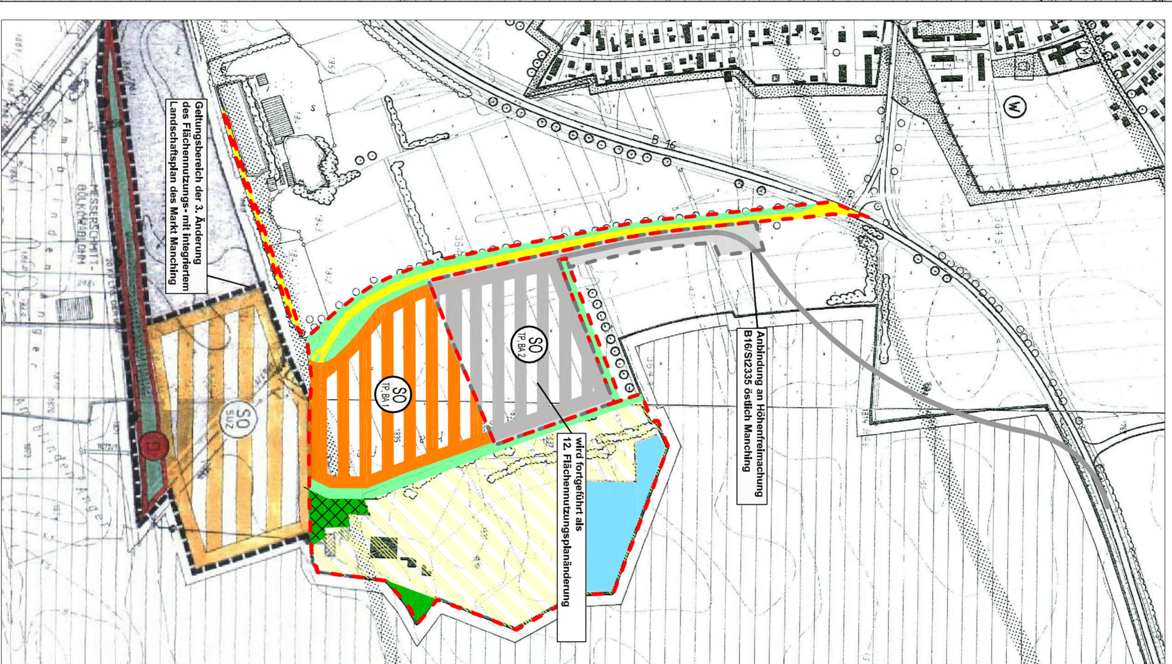
9. Änderung des Flächennutzungsplans mit integriertem Landschaftsplan Manching Der Flächennutzungsplan wird für den Bereich des Bebauungs- und Grünordnungsplans 'Technologiepark Ost' wie folgt geändert: