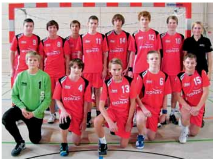
Männliche B-Jugend der MBB SG Manching.