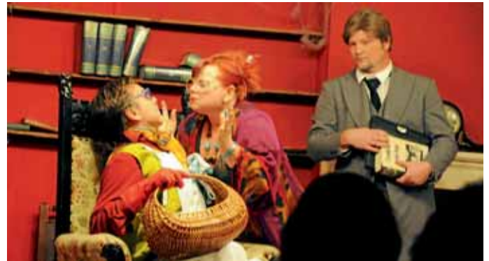
Szene aus der Kriminalkomödie der Oberstimmer Theatergruppe.