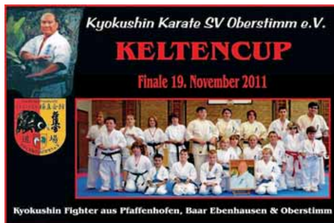
Die Keltencupgewinner 2011