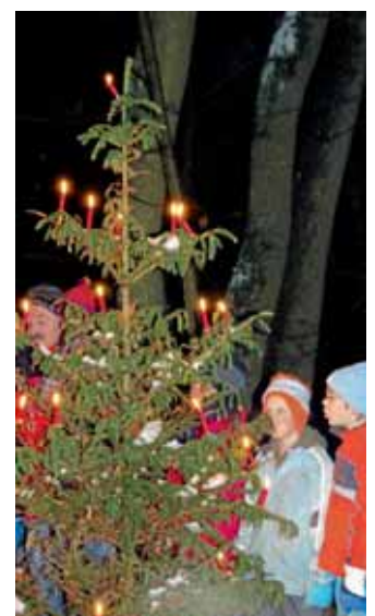
Weihnachtliche Lieder am leuchtenden Tannenbaum bei den Trachtlern.

Das neue Jahr beginnen wir mit der Dreikönigs-Wanderung am 6. Januar, zu der wir alle Interessierten recht herzlich einladen wollen. Treffpunkt ist am Parkplatz bei der Hallertauer Volksbank um 14.00 Uhr.