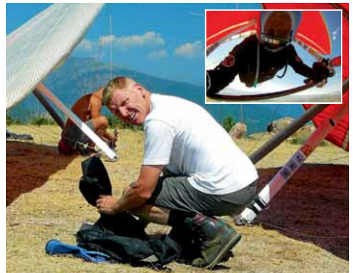
Vorbereitung für das Drachen-Streckenfliegen