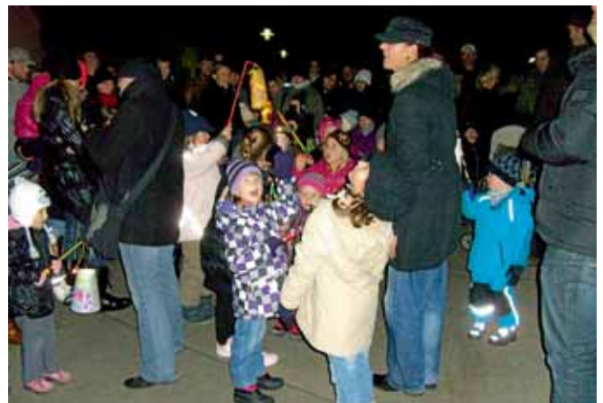
Laternenfest im Kindergarten Pichl: Am 11.11.2011 feierte der Kindergarten Pichl sein Laternenfest. Nach einem kleinen Martinspiel im Garten zogen die Kinder in Gruppen, angeführt von St. Martin auf seinem Pferd, zum Sportplatzgelände. Unterwegs sangen alle fleißig Laternenlieder. Dafür gab es zur Belohnung ein großes Lagerfeuer und Leckereien der Eltern.