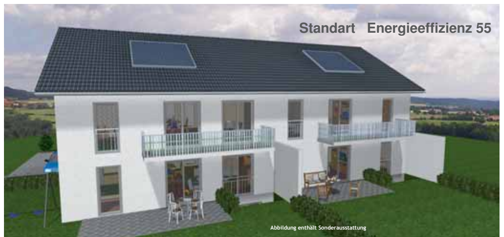
Abbildung enthält Sonderausstattung

IWG.UG Immobilien – Wohn- und Gewerbebau Ökologisches Energieeffizientes Bauen. Mit der Natur für die Natur