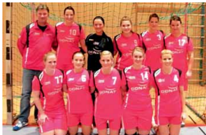
Damenmannschaft der MBB SG Manching.

Mit einem verdienten Heimsieg gegen den TSV Erding (20:17) und trotz der 26:36-Niederlage beim verlustpunktfreien TSV Gaimersheim liegt die