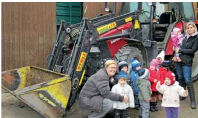
Jedes Kind der Zwergengruppe durfte auf dem Traktor Platz nehmen.