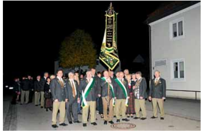
Mit einem Festzug zur Kirche begann die Feier der Hubertusschützen in Niederstimm.