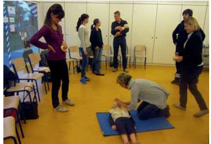
Einen Crashkurs über Kindernotfälle nutzten viele Krippeneltern, um Ihre Erste-Hilfe-Kenntnisse zu erweitern bzw. zu intensivieren. Es wurden von einem Ausbildungsleiter des BRK-Kreisverbandes Pfaffenhofen die wichtigsten Kindernotfälle theoretisch und praktisch behandelt. An verschiedenen Stationen konnte dann das theoretische Wissen in die Praxis umgesetzt werden. Der Abend dauerte 3 Stunden und war sehr interessant und kurzweilig. Markt Manching (ApS)