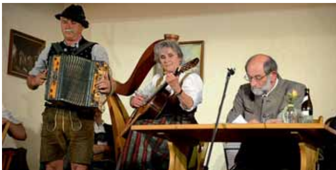
Ein Hochgenuss an bayerischer Hausmusi wurde beim Manching Hoagarten geboten.