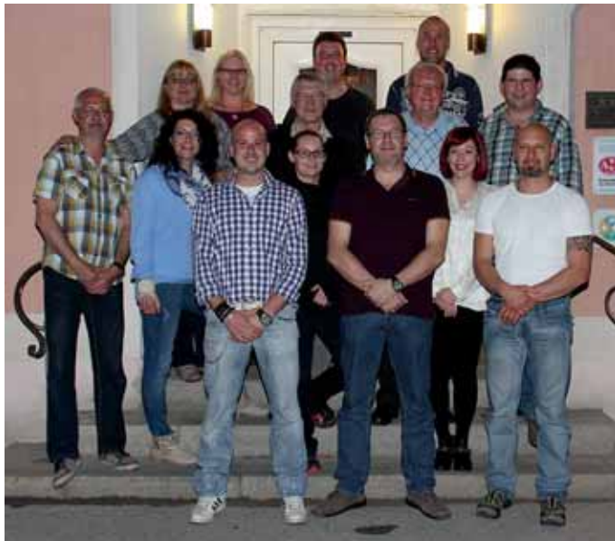
Der neue Ausschuss der Theaterbühne.