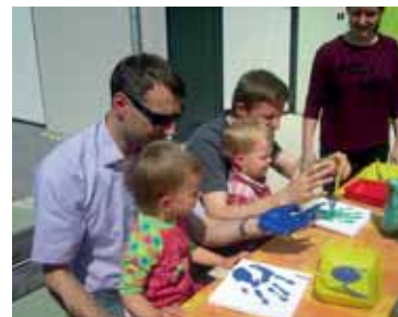
Am Freitag, 22. Mai, fand unser 1. Papa-Kind-Nachmittag statt. Es kamen 34 Väter zu uns in die Krippe, um mit Ihren Kindern einen unterhaltsamen und lustigen Nachmittag zu verbringen. Es wurden verschiedene Aktionsstationen aufgebaut (Schubkarren-Parcours-Fahren, Rollbrett-Aufwickeln mit Kind, Schwungtuchübungen, Handabdrücke etc.), an denen die Väter sich aktiv beteiligen mussten. Erst dann bekamen sie den ersehnten Stempel auf ihre Karte und zum Abschluss gab es für das Kind und den Papa noch eine süße Belohnung. Zwischendurch durfte im Garten gespielt werden und als krönender Ab-

schluss traf man sich zum Stockbrot-Grillen. Dazu gab es Wiener, verschiedene Getränke, Salzgebäck u.v.m. Entgegen der Wetterprognose war es ein sonniger Nachmittag mit angenehmen Temperaturen. Viele Mütter waren „neidisch“, dass sie dieses Jahr nicht in den Genuss einer Feier gekommen sind.