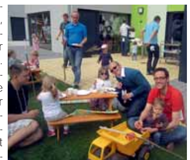
Markt Manching (ApS)

Aber das Sommerfest am 4. Juli um 14:30 Uhr steht bereits vor der Tür, und so kann dann gemeinsam gefeiert werden. In diesem Jahr standen die Väter im Vordergrund – was ihnen auch sichtlich gefallen hat.