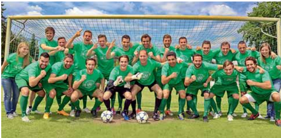
So sehen Meister aus! Ausgelassen feiern die Spieler ihren Erfolg.