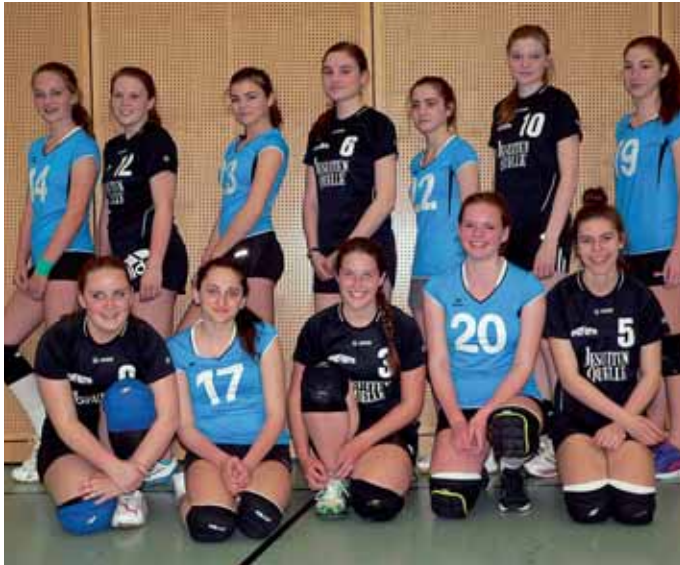
U18w1 und U18w2 der MBB-Volleyballabteilung. Alois Rieder

Auf Rang sechs und sieben beendeten die beiden U18-Mädchenvolleyballteams der MBB-SG Manching das Kreispokaltournament 2015 des Kreises Oberbayern Nord. Beim Vorrundenturnier am 8. März in Eichstätt verpassten beide Mannschaften den Halbfinaleinzug, wobei die U18w1 durchaus Siegchancen gegen Eichstätt und Schrobenehausen gehabt hatte. Im Platzierungsturnier am 26. April in Freising setzte sich dann die Manchinger U18w2 als Sechtplatzierter vor der U18w1 durch, während das Team des SC Frei-