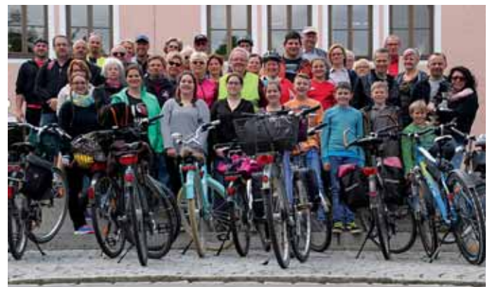
Alle sportlichen Radler der Theaterbühne.