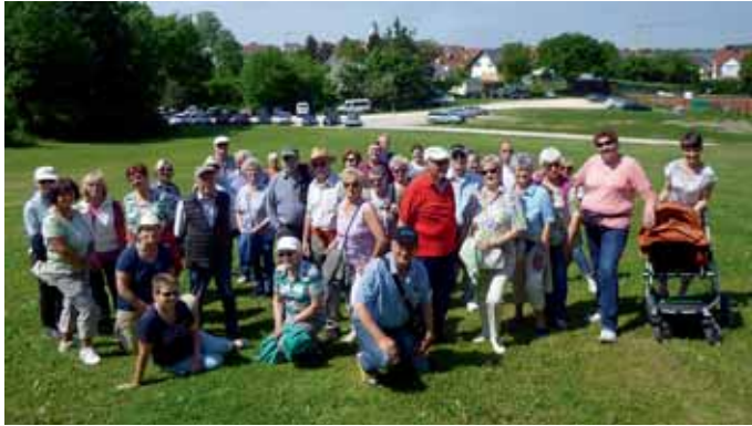
Herrliche Aussicht vom Schlittenberg im Sportpark über Manching