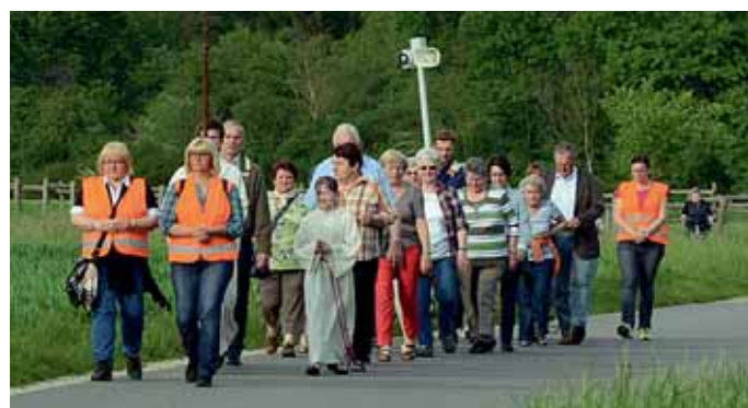
Zahlreiche Gläubige aus Manching machten sich, vom Feldkreuz des Trachtenvereins in der Au, zu einem Bittgang über die Manchinger Flur zur St. Leonhardt-Kirche nach Pichl auf. Der alte Brauch der Bitttage, bei dem der Rosenkranz gebetet wird, hat in Bayern eine lange Tradition und wird vor allem an den drei Tagen vor Christi Himmelfahrt mit den Ministranten, die den Zug anführen, durchgeführt.