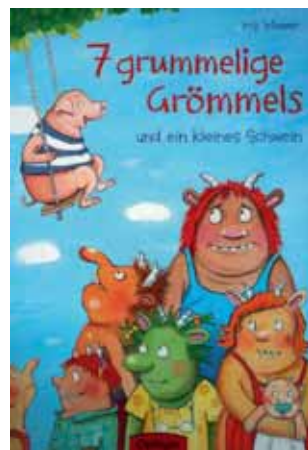
Markt Manching (GrM)

Außerdem gibt es über 100 Familien- und Brettspiele zum Ausleihen in der Bibliothek.