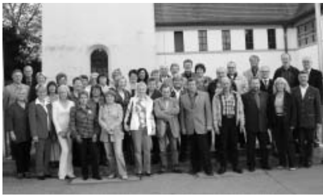
Zum Klassentreffen traf sich der Schuljahrgang 1955 aus Manching in der Gaststätte Euringer in Oberstimm, um nach langer Zeit wieder alte Erinnerungen aus der gemeinsamen Schulzeit auszutauschen. Die Feier, die mit einem Erinnerungsfoto begann, endete erst in den frühen Morgenstunden. Schmidtnr