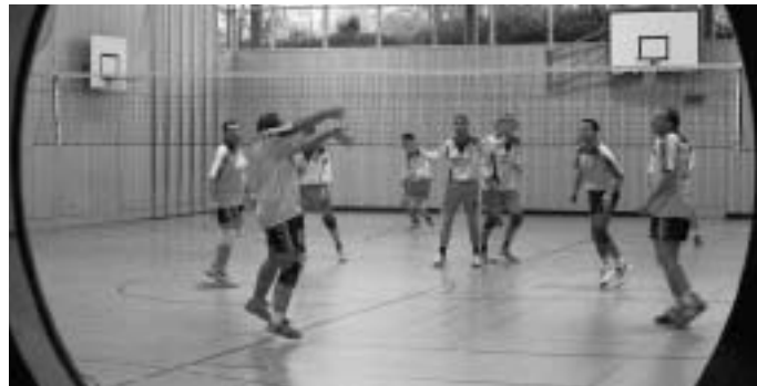
Heimspiel der MBB Herren I in der Mehrzweckhalle im Lindenkreuz im Blick durch die Hallentür

Schon eine Woche nach dem Hinspiel gegen den TSV Kösching III mussten die MBB Her-