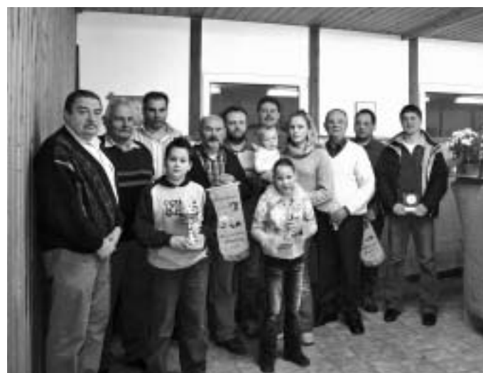
Stolz präsentierten sich die prämierten Züchter samt Nachwuchs der Manchinger Kleintierzüchter.