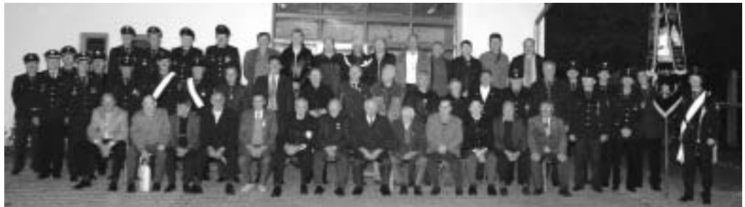
Fast das halbe Dorf stand in Westenhausen bei der Feuerwehr zu Ehrungen an.