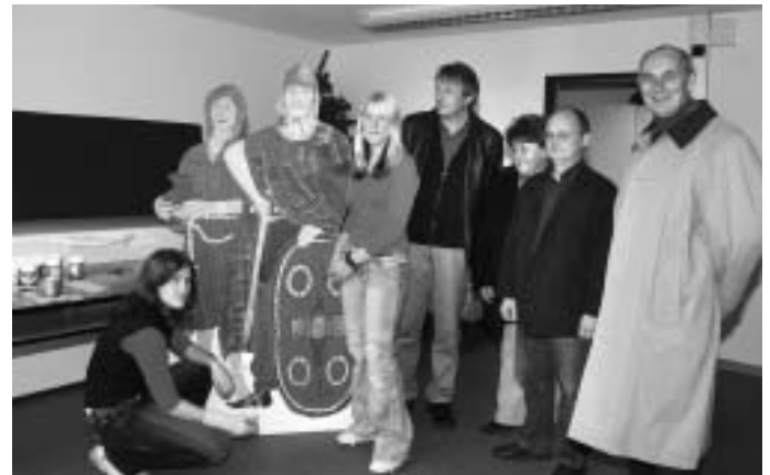
Ein dickes Lob gab es für die künstlerisch veranlagten zwei Schülerinnen und ihre gelungenen Malerarbeiten. Schmidtner

Manching rüstet ab dem kommenden Jahr mit werbeträchtigen Hinweisen für das neue archäologische Zweigmuseum, das voraussichtlich im Juni 2006 eröffnet wird.