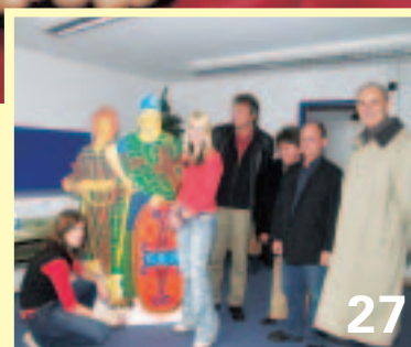
Schüler malen für das Museum