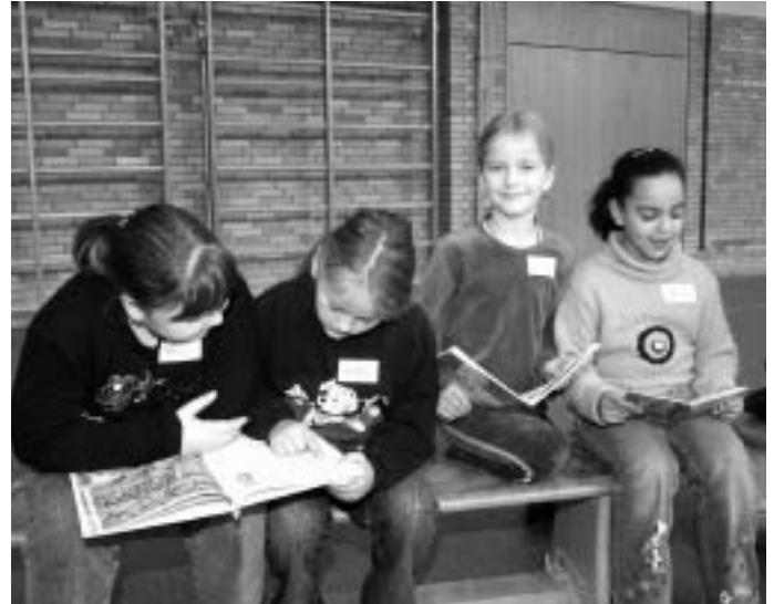
Zum bundesweiten Vorlesetag wurden auch in Oberstimm von den Schülern Geschichten vorgelesen. Schmidtnr

gegenseitig vorzulesen und zuzuhören. Da wurden „Wilde Kerle“ lebendig und mit großen Augen und Ohren lauschten die Schüler den Abenteuern der „Hexe Lilli“, einem türkischen oder russischen Märchen. Wie toll das Vorlesen sein kann, zeigten einige Schüler und Schülerinnen auch den Kindergartenkindern im Donaufeld, in Pichl und Oberstimm. Die freuen sich schon, im nächsten Jahr selbst lesen zu lernen. Es ist geplant einen Vorlesetag in den Manchinger Bibliotheken oder eine Lesenacht folgen zu lassen. Schmidtnr