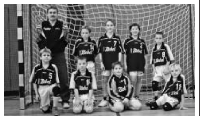
Männliche E-Jugend 2005/2006 Turnier am 13.11.2005 in Schrobenhausen